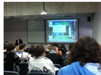
大学正規授業聴講

研修内容：1. オタゴ大学付属語学センターでの英語研修 2. オタゴ大学での正規授業聴講 3. インターンシップ 4. ホームステイ（食事付き）