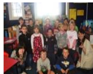
インターシップ先小学校にて