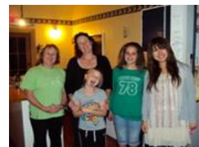
ホームステイ先にて